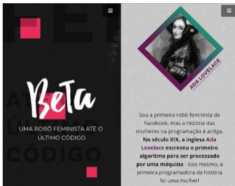
Figura 4. Prints da página oficial da robô Beta: a capa de abertura e a imagem de Ada Lovelace com a legenda identificando-a como a mulher que escreveu o primeiro algoritmo para processamento por máquina. Dimensão: 11,11cm X 14,24cm. Disponível em www.beta.org.br , acesso a 28/01/2018.

Tal vetor se confirma, a exemplo brasileiro, no ciberativismo com protagonismo de Beta, uma robô programada para interagir com usuárias/os pelo facebook e por e-mails sobre atuação política e empoderamento, informando propostas abusivas, desrespeitosas e violadoras que tramitam no Congresso. A interação é prática e através de orientações (a partir de respostas objetivas), instruindo e incentivando movimentações e denúncias de atos contra mulheres.