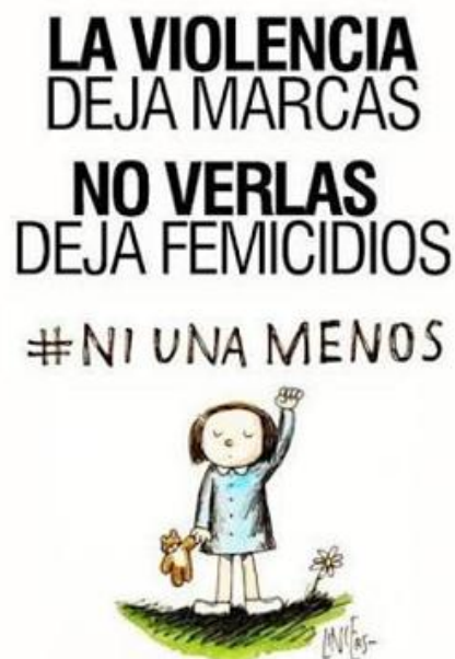
Figura 3. Ilustração de Liniers para site #niunamenos. Disponível em: http://niunamenos.com.ar/?page_id=167#/lightbox&slide=1 , acesso a 28/01/2018.

Os dados são alarmantes e definem o problema social: a cada 30 horas, uma mulher é morta e no último mapeamento o aumento foi substancial entre os anos de 2008 e 2015 (incluindo todo debate por legislações específicas). Um grupo de jornalistas, ativistas e produtoras culturais despontaram com a iniciativa e a opinião pública foi rapidamente favorável, tomando a campanha para si. Milhões de pessoas, organizações, escolas, militantes de diversos partidos e integrantes da sociedade civil corporificaram a Ni una a menos , que se tornou agenda pública e política.