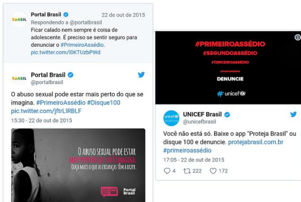
Figura 2. Prints das campanhas do Portal Brasil e da Unicef. Dimensão: 11,56cm X 17,25cm. Disponível em https://brasil.elpais.com/brasil/2015/10/22/politica/1445529917_555272.html , acesso em 29/01/2018.

Face ao questionamento da veracidade do seu depoimento e culminando com a repercussão na internet dos comentários sobre a criança do Master Chef , a Think Olga lançou na rede a hashtag #meuprimeiroassédio que obteve significativa adesão com mais de 82 mil postagens na rede social twitter . Com análise de 3.111 histórias, chegou-se à conclusão de que a idade média do primeiro assédio era de 9,7 anos. 4 A partir da iniciativa, instituições como o Portal do Governo Federal e a Unicef aproveitaram para reforçar as suas próprias campanhas contra a violência e exploração sexuais com ênfase na infância.