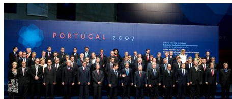
Cimeira de Lisboa, 2007

Estas novidades, no entanto, não alteram em nada a distinção entre as competências supranacionais da Comissão e as intergovernamentais do Conselho. Quando, por exemplo, a Senhora Ashton precisa de intervir na área da prevenção e resolução de conflitos [violentos] através de instrumentos de cooperação para o desenvolvimento (principalmente o instrumento financeiro para estabilidade), ela fá-lo no quadro das competências tradicionais da Comissão baseadas em procedimentos semi-supranacionais. Quando agir na área da política, diplomacia e segurança, mudará de chapéu e tornar-se-á o que Javier Solana era antes: uma representante do Conselho e dos estados membros, e não uma decisora política 1 . Portanto, as novas provisões não apontam para uma Europa mais integrada: elas não fortalecem as competências da UE na área dos assuntos externos. Apenas criam uma ponte entre duas esferas de acção europeia, mantendo, no entanto, intacto o dualismo entre o Conselho e a Comissão 1 .