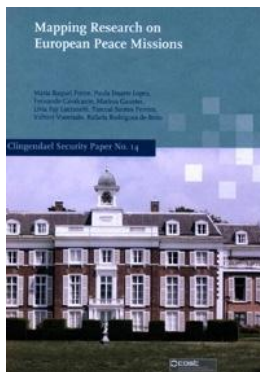
Mapping research on European Peace Missions

O projecto “Mapeamento da Bibliografia sobre Missões de Paz Europeias” no âmbito da Acção COST IS0805 “Novos Desafios de Peacekeeping e o Papel da União Europeia na Gestão Multilateral de Crises” resultou na publicação de um livro que apresenta o levantamento e análise da bibliografia existente sobre missões de paz europeias desde a década de 1990 até ao Tratado de Lisboa (2010). O trabalho começa com os debates iniciais sobre segurança e defesa europeia e segue as linhas temáticas definidas pela Acção COST: cooperação da União Europeia (UE) com outras organizações internacionais na gestão de crises; processos de tomada de decisão e planeamento; e avaliação das missões. A bibliografia desde 1999 é sistematizada de acordo com estas linhas temáticas, identificando-se as questões fulcrais tratadas na bibliografia revista e as principais tendências associadas a essas questões.