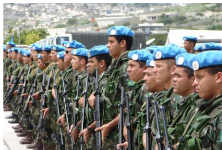
Contingente brasileiro da MINUSTAH (Missão das Nações Unidas para a Estabilização do Haiti), Port-au-Prince, 2005

mandato (Chopra, 1998), o que nem sempre é consistente com o tratamento neutro das partes.