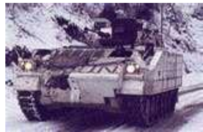
Patrulhamento da UNPROFOR (Força de Protecção das Nações Unidas), Bósnia Herzegovina, 1994

Paralelamente, com a diminuição do risco de confrontação entre as grandes potências, os conflitos intra-estatais ganharam lugar de destaque na agenda internacional, em parte, devido às suas consequências transnacionais. Isto, aliado à crescente legitimidade dos direitos humanos resultaram na ampliação do conceito de segurança e na percepção de violações massivas como uma ameaça internacional, permitindo, inclusive, práticas interventivas, sob os auspícios das Nações Unidas, com base na justificativa humanitária (Finnemore, 2003; Rodrigues, 2000).